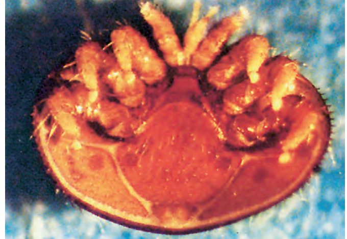
أنثى الفاروا من ناحية البطن

التي تحمل أكثر من أنثى الفاروا تموت في النخروب، بينما الفاروا تتابع حياتها. في حين ان النحلة التي تنجو من الموت تخرج ضعيفة ومشوهة وتحاول أن تتخلص من الطفيلي لكنها تصبح متوترة وعصبية. • ان حشرة الفاروا لا تتكاثر في فصل الشتاء مع اختفاء الحضنة، وتبقى معلقة على جسم النحلة وعندما تبدأ الملكة بوضع البيض تدخل الفاروا إلى النخاريب عندها تصبح بعيدة عن تأثير الأدوية المعالجة. من هنا، أهمية اختيار فترة العلاج وهي عند اختفاء الحضنة.