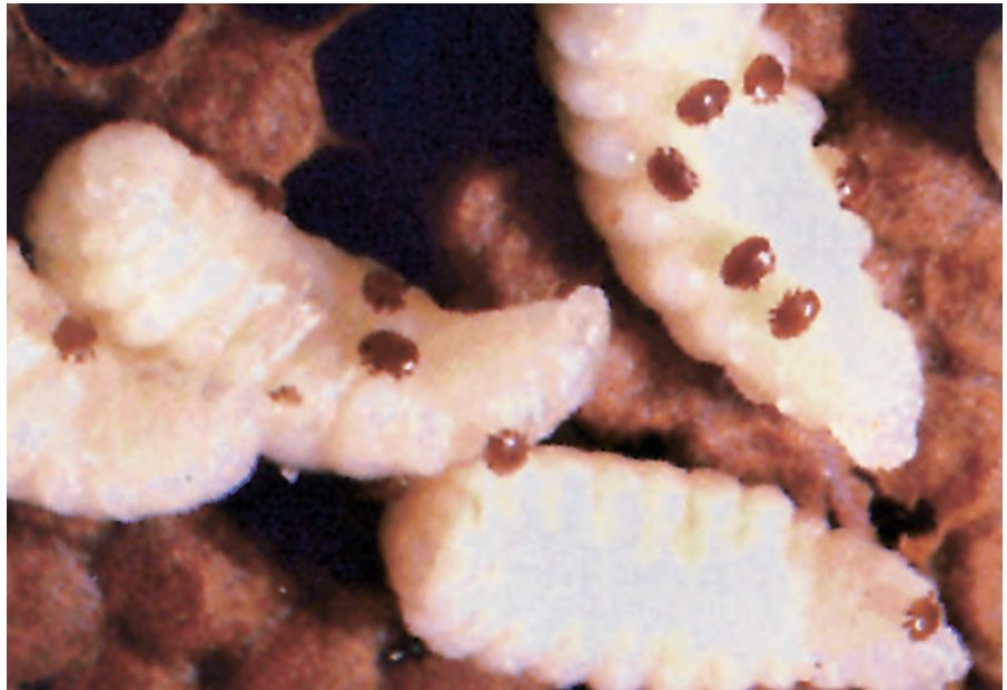
تظهر حشرات الفاروا على عناري النحل

• ان الفاروا هو مرض طفيلي خارجي (أكاروز) يعيش على جسم النحل في كل أطواره وحيث يمتص سائل الجسم. • يمكن رؤية هذه الحشرة (أكاروز) بالعين المجردة، فالأنثى تكون ذات لون