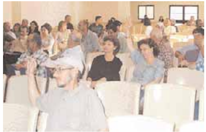
إبراء ذمة مجلس الإدارة