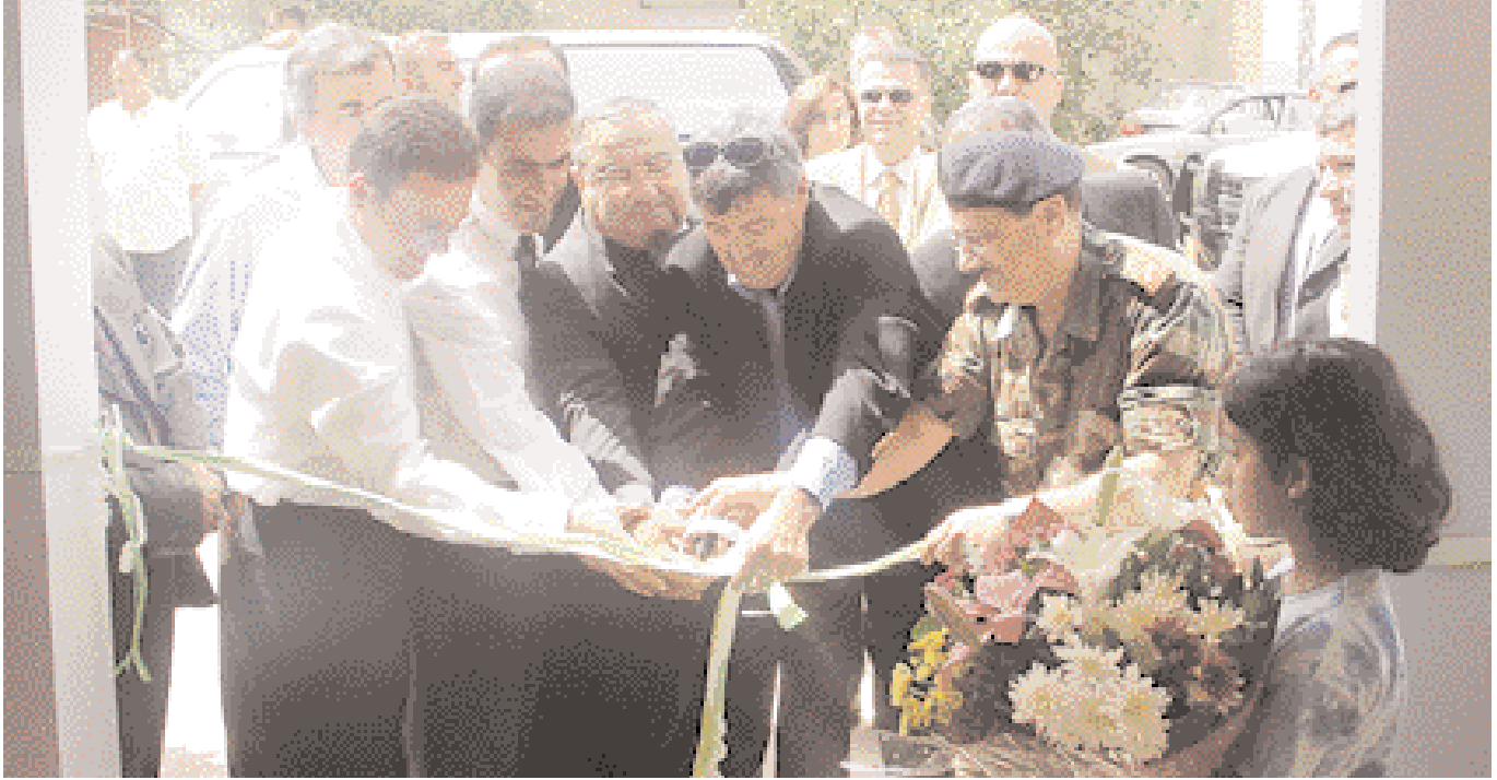
يقصون شريط افتتاح المركز

أعضاء التعاونية وعائلاتهم وأبناء المنطقة باستعمال خدمات الإنترنت لأغراض تربية وتدريبية وترفيهية وتطوير مهاراتهم في استعمال الكمبيوتر من دون أن يتكبدوا مشقة الانتقال إلى خارج المنطقة. وقد علمت ان هذا المركز بدأ يستقبل أسبوعياً أكثر من ٢٠٠ شخص يقصدونه خصوصاً في نهاية الأسبوع لأغراض متنوعة، بحيث تبقى أبوابه مشرعة إلى الأولى بعد منتصف الليل."