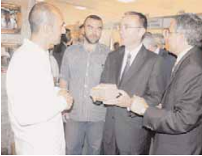
السفير فيلتمان في معرض «صنع في أميركا»

وفي ختام المهرجان تسلّمت الجمعية التعاونية جائزة شكر وتقدير من رئيس بلدية جزين المحامي سعيد بو عقل لمشاركتها وتعاونها في هذا المهرجان السنوي وهي الجائزة الثانية بعد مشاركتها في المهرجان التراثي لعام ٢٠٠٣ .