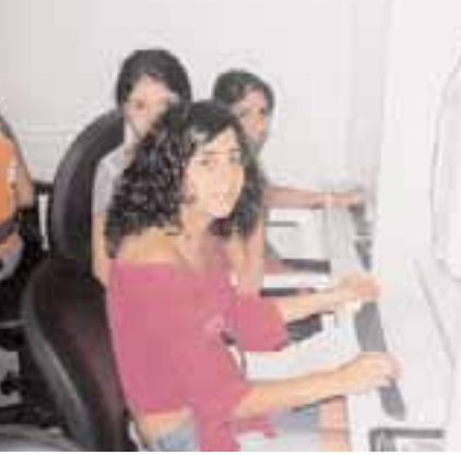
بعض الوجوه المشاركة في الدورة

وعن دورة الكمبيوتر، أوضح ربيع سلامة وهو في