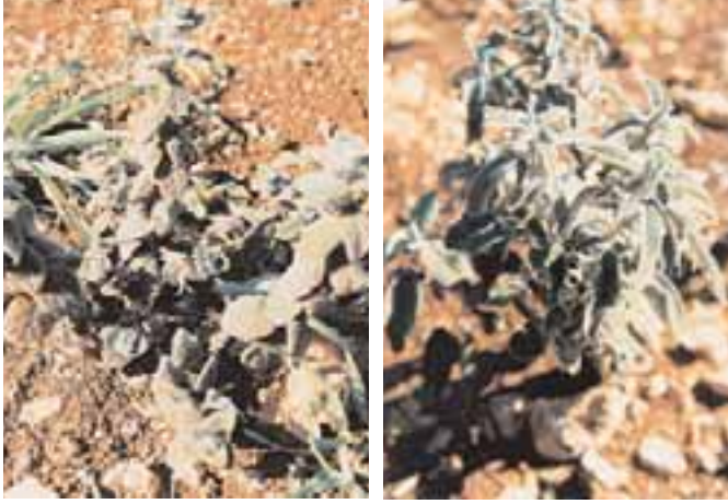
من الأعشاب الطبية

وفير لكن تربتها كلسية، أما التربة في المناطق الجبلية كصيدون وعاربه فخصبة لكن المشكلة هي في تأمين مصدر للمياه حيث يعتمد المستفيدون إلى شراء المياه لري المزروعات."