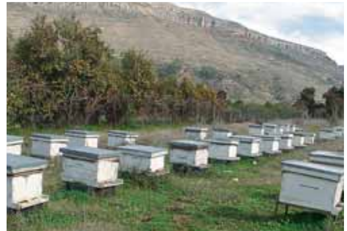
الوجهة والمسافة الصحيحة للمناحل

أولاً: يجب نقل القفران إلى المناطق الساحلية التي تتميز بدفئتها في فصل الشتاء وتوفّر المرعى الملائم فيها بدءاً بزهر الأكي دنيا والليمون وغيرها.