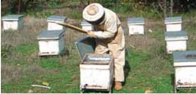
الكشف الدوري على القفران

مع اختلاف فصول السنة تتطلب إدارة المناحل اتخاذ بعض التدابير الضرورية لحماية النحل خصوصاً في الفترة الممتدة من شهر تشرين الأول لغاية شهر شباط حيث يجب على النحال التقيّد والعمل على تنفيذ الأمور المدرجة أدناه للحوّول دون فقدان قفران النحل.