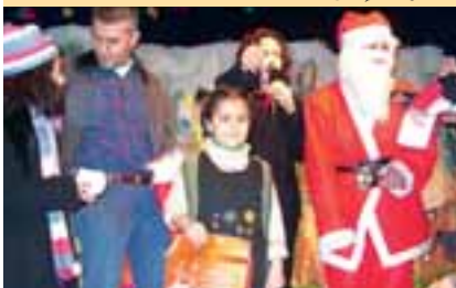
خلال توزيع جوائز التومبولا

ووزّع "بابا نويل" الهدايا على الأطفال الذين راوحت أعمارهم من ٣ سنوات إلى ١٥.