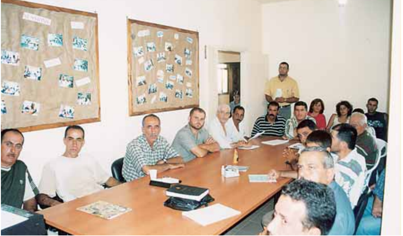
في إحدى الدورات التدريبية التقنية