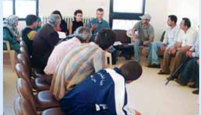
في إحدى حلقات التركيز مع المصابين من الحرب

ثمانية عشر شهراً آخرين لم يأتوا من لا شيء بل نتيجة دراسة نفذها فريق عمل مشروع جزين شملت عقد عدّة حلقات تركيز Focus Groups مع عدد من المصابين من الحرب ومع رؤساء البلديات والأعضاء ومخاتير بلدات قضاء جزين.