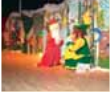
مشهد من المسرحية

لمناسبة الأعياد، نظمت الجمعية التعاونية الإنمائية بالتعاون مع الصندوق الدولي للتأهيل بتاريخ ٢٠٠٤/١٢/٣٠ مسرحية "حبّ ليلة عيد" لفرقة ميمي فرح على مسرح دير سيدة مشموشة.