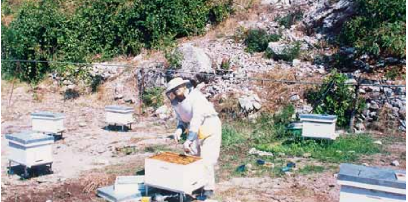
أثناء تفقده قفران النحل

ويتابع " بعد ان تحسّن وضعي الصحيّ وخفّ الألم من معدتي حيث أصبت وذلك بتناول الأدوية بشكل مستمرّ، لجأت إلى العمل قليلاً في الزراعة بالقرب من المنزل بهدف التسلية، هذا بعد أن توجه أولادي إلى المدينة للعمل وبناء أسرة، ولكن الوحدة مرّة ولا أحبّ أن أكون ثقلاً على أحد "