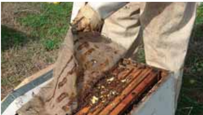
التغذية بواسطة الكندي

خامساً: نزع البراويز الفارغة وخصوصاً القديمة منها (شمع أسود).